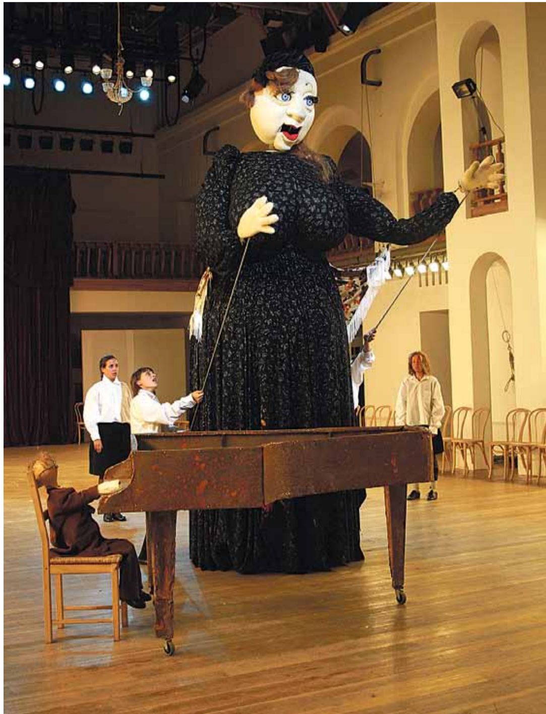
«Oopus nr 7». Emake Venemaa ja Šostakovišt.

Krõmovi lavastused ei ole elitaarsed, tudengite kõrval naudib neid ka tõusev Vene keskklass – mitte uusrikkad, vaid ausalt tasapisi rikastunud inimesed, kes hoolivad oma ühiskonnast