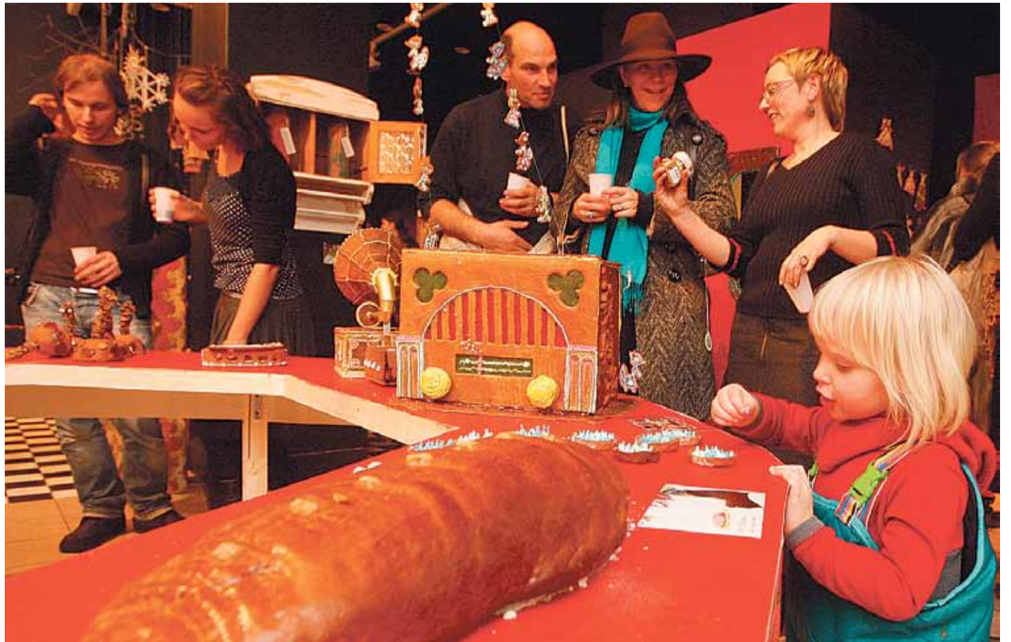
PiparkoogiMaania võlupoes on väikestel ekspertidel ja vanematelgi kõvasti tegemist. Kauba kvaliteediga võib täiesti rahule jääda.