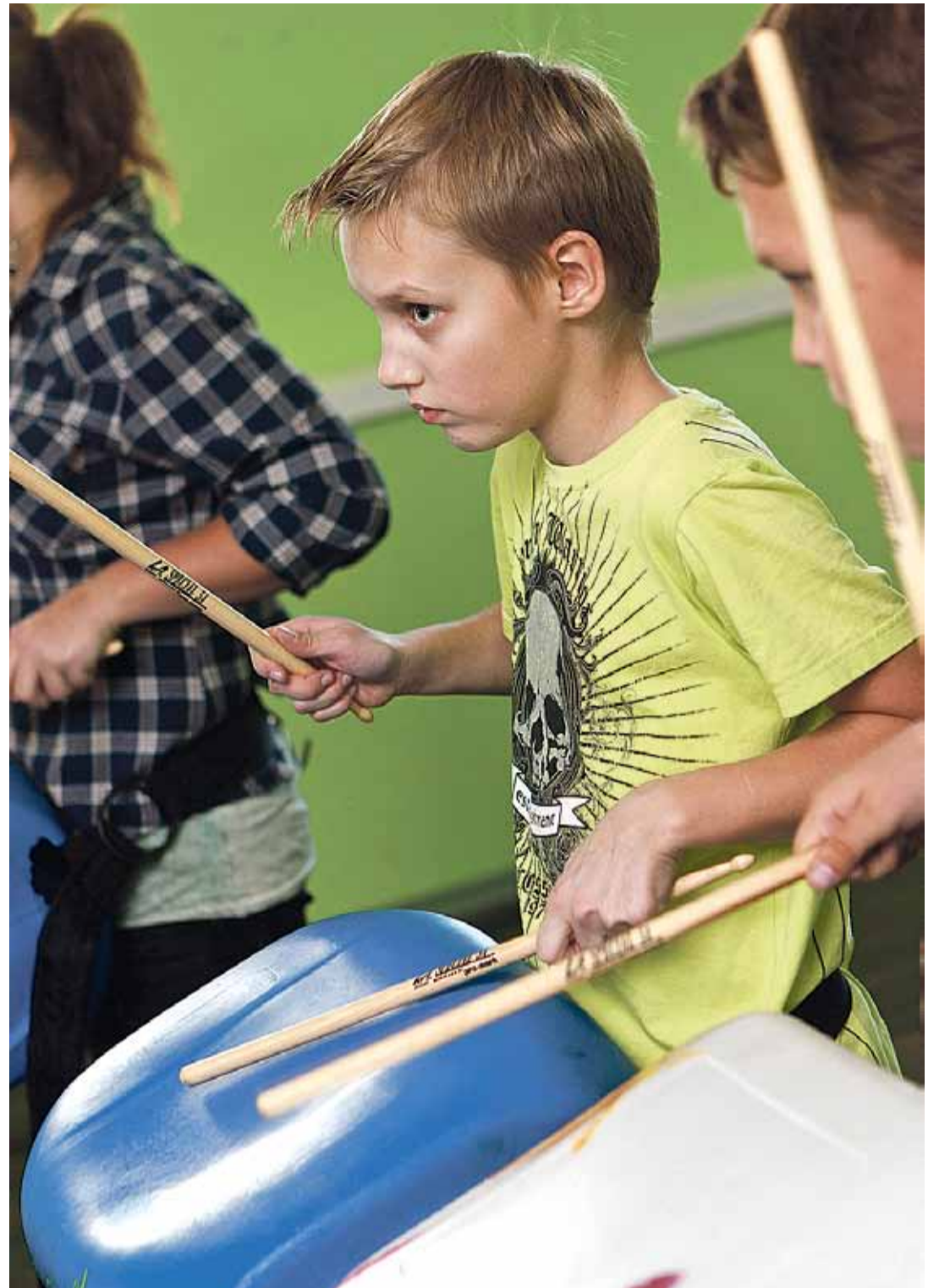
Nõuab palju tööd, et lapsed oma oskustest aimu saaksid ja endasse uskuma hakkaksid.

Olen püüdnud ennast sellega järjst rohkem kurssi viia, eriti meeldivad mulle ansamblid, kes