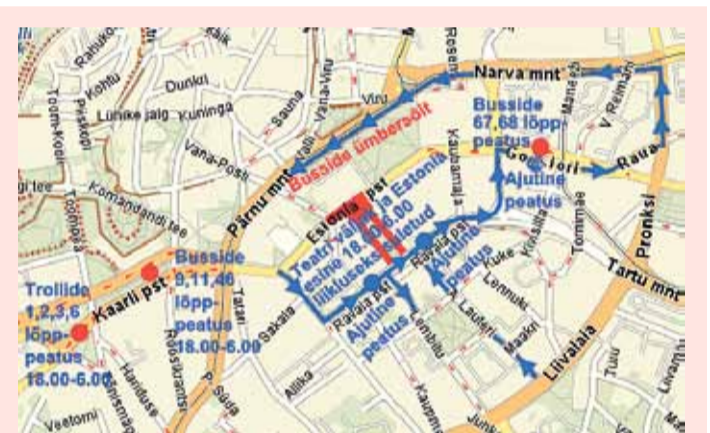
Graafika: Oliver Õunmaa

21.00–01.00 Avatud on kultuurikioskid söögi ja joogiga ning kultuuripealinna ja euro meenetega 22.30–22.35 Õhtujuhtide tervitus ja programmitutvustus 22.35–23.00 Esinevad Kukerpillid 23.01–23.05 Tantsu-show 23.05–23.45 Esinevad Tanel Padar & The Sun 23.45–23.55 Eesti Vabariigi Presidendi telepöördumine ekraanidel 23.55–23.58 Hümn 23.58–00.00 Õhtujuhi sõnad 00.00–00.02 Ilutulestik Pirita teel ja merel. Tulevärki saab vaadata ka ekraanidel. 00.02–00.07 Ilutulestik Solarise katuselt 00.07–00.13 Kultuuripealinna ava-show 00.13–00.25 Esineb Iiris 00.25–01.00 Esinevad Kukerpillid