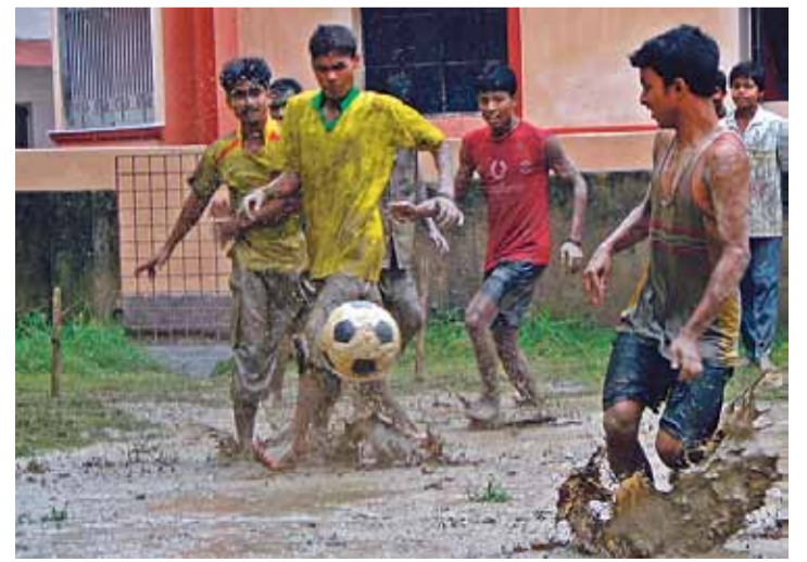
Jalgpall õpetab meeskonnatöö olulisust ja kasvatab mängulusti.

Viimase 13 aasta jooksul on tema projektis osalenud umbes 10 000 vabatahtlikku.